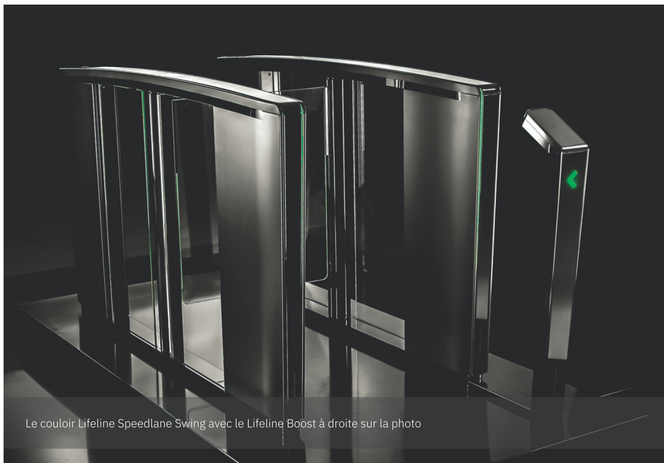
Le couloir Lifeline Speedlane Swing avec le Lifeline Boost à droite sur la photo