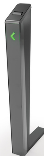
Collecteur de badges