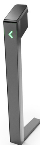
Modèle standard Premium