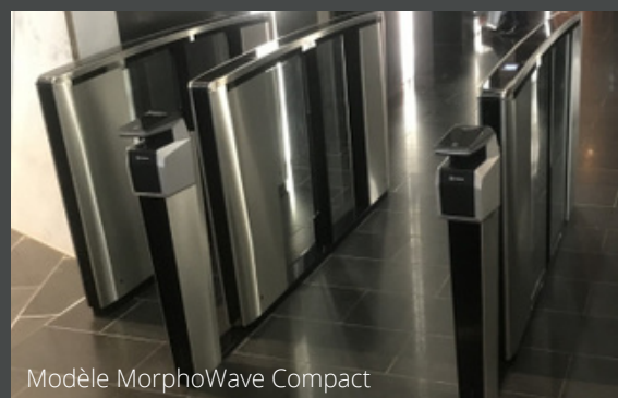
Modèle MorphoWave Compact