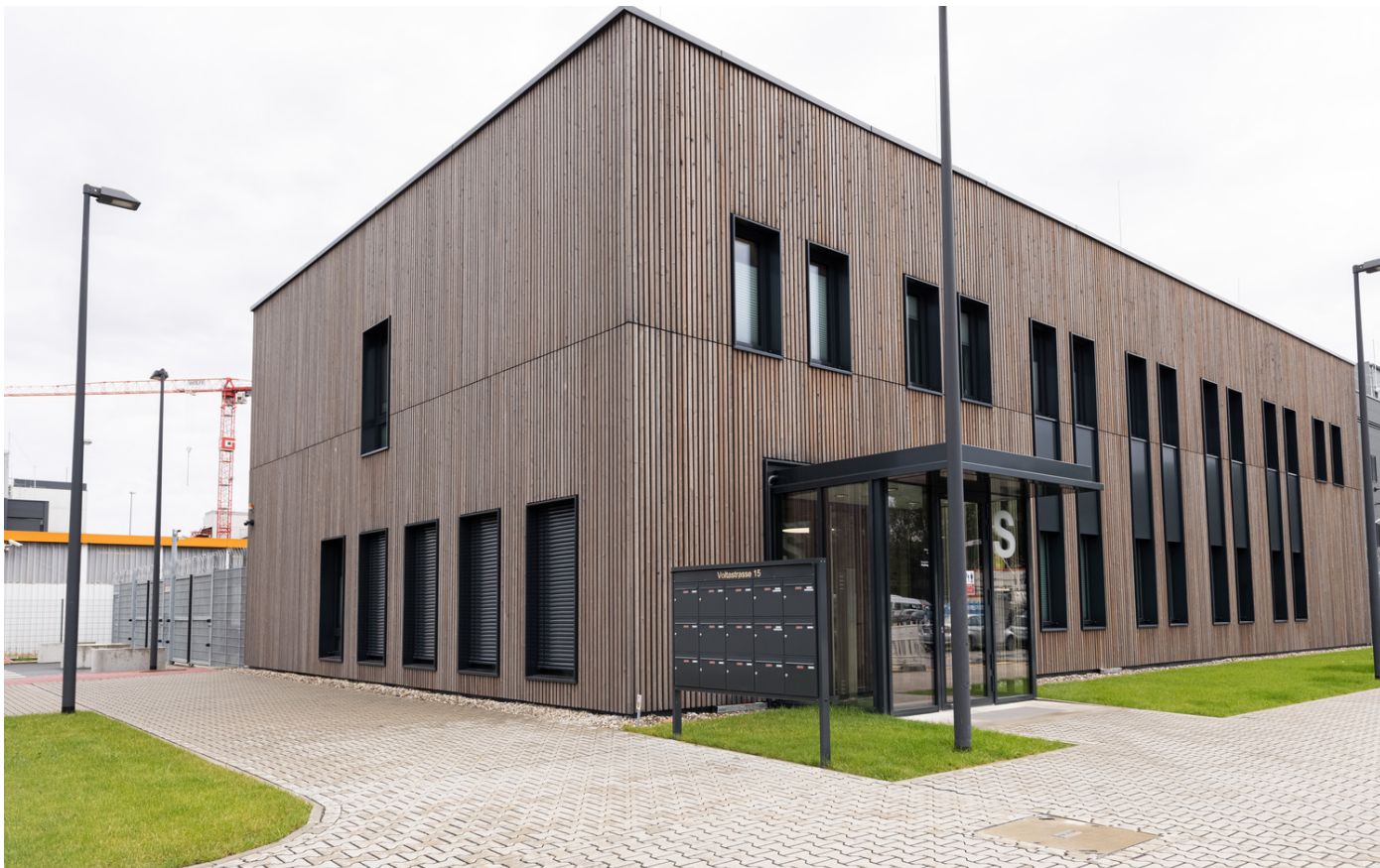
E-SHELTER SECURITY GMBH Standort: Voltastraße 15, 65795 Hattersheim am Main Objektart: Rechenzentrum