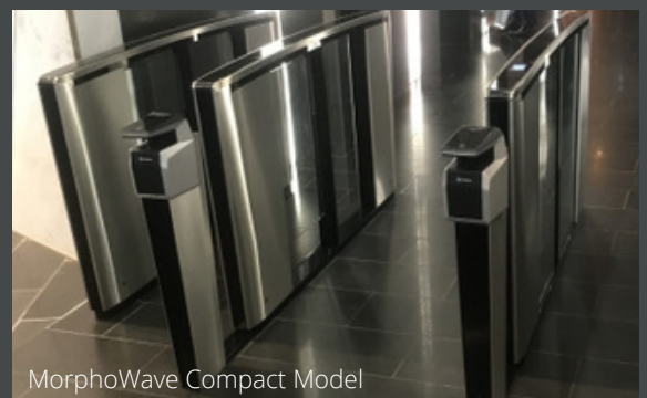
MorphoWave Compact Model