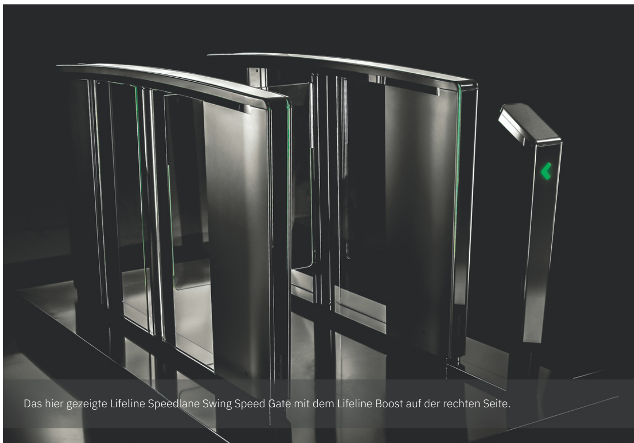
Das hier gezeigte Lifeline Speedlane Swing Speed Gate mit dem Lifeline Boost auf der rechten Seite.