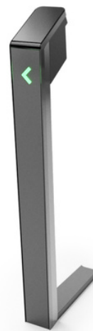
Standard Premium Model